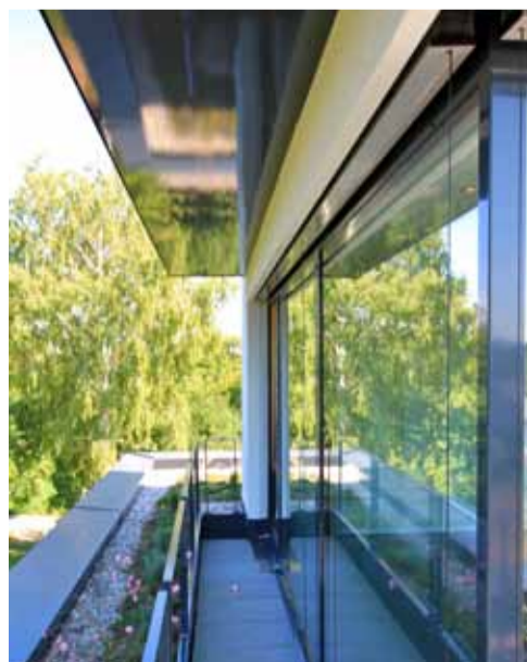
Klare Linien, klarer Blick zum Ziegeleipark.