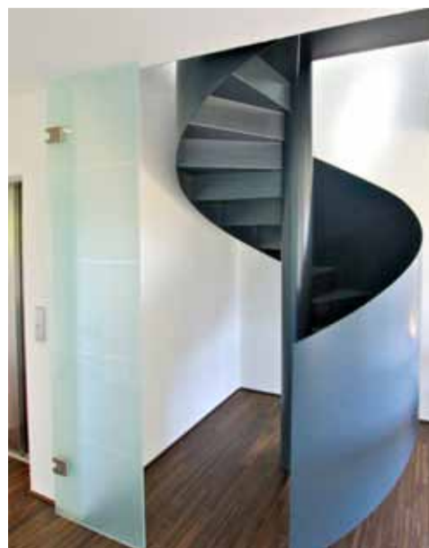
Aus einem Guss: Spindeltreppe aus Stahl.