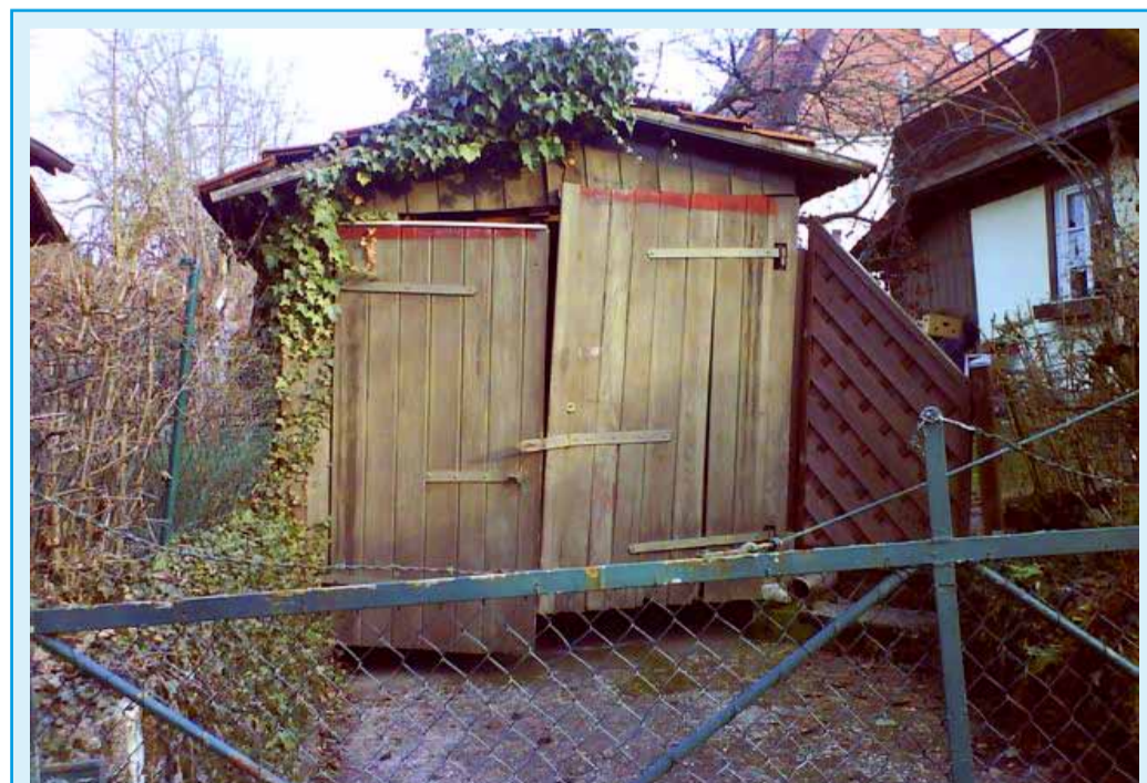
Das Neueste aus unserer Reihe „Do it yourself“