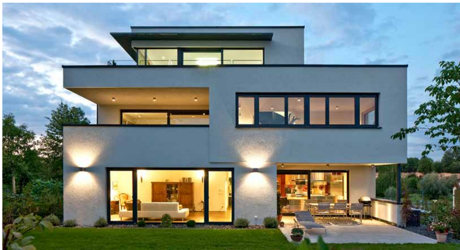
Moderne Architektur mit moderner Technik: Eine Erdwärmepumpe speist Wand- und Fußbodenheizung im Haus, eine zweite Wärmepumpe bringt das Wasser auf Temperatur. Und wenn es draußen warm genug ist, können sich die Bewohner auf drei Freisitze verteilen, die jeweils uneinsehbar sind.