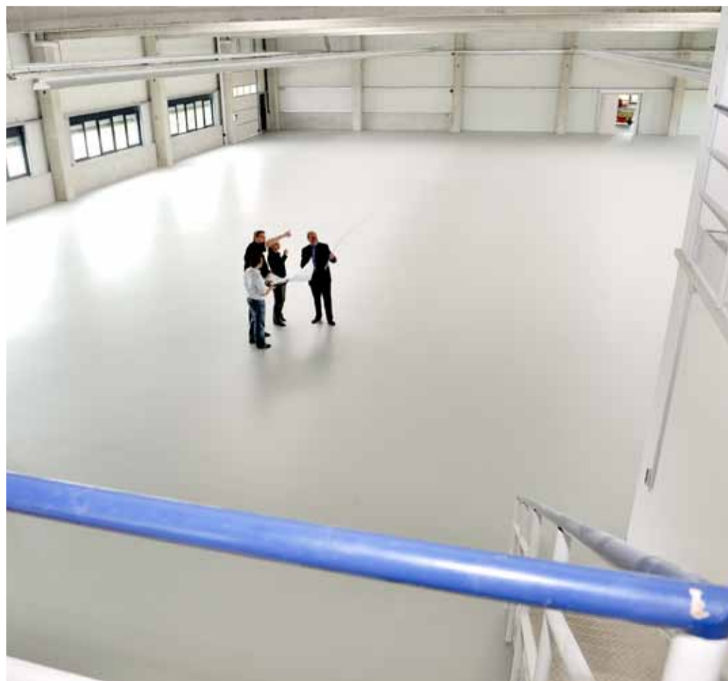
Der Estrich ist kaum trocken, bald wird in der Halle hoch entwickelte Sensortechnik hergestellt.

Markt gebracht. Die Nachfrage nach den elektronischen Komponenten wächst so stark, dass die bisherigen Produktionskapazitäten mehr als ausgelastet sind. Die neue 1200 Quadratmeter große Halle beendet die beengten räumlichen Verhältnisse