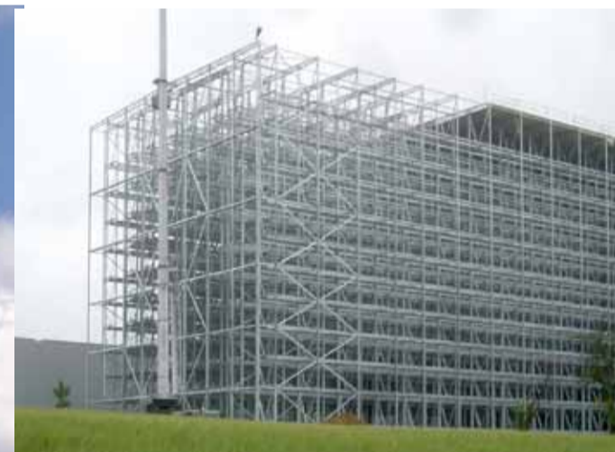
Labyrinth aus Stahl: Skelett eines groß dimensionierten Hochregallagers (oben), vor dessen Fassade die Bauarbeiter wie winzige Puppen wirken. Die Heilbronner Ideal-Group macht mit dem Hochregallager die Arbeitsabläufe effizienter.