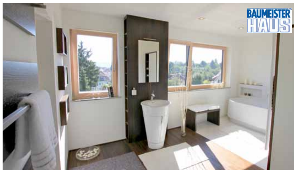
Ein Badezimmer mit Blick über Böckingen und Tür zur Sauna, die sich linker Hand anschließt.

Michael Wiesner: 07131 / 2610-220 michael.wiesner@boepplebau.de